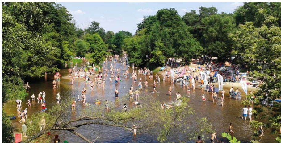
Fot. 1. Otwocka Plaża Miejska nad Świdrem w Otwocku (fot. A. Pyra)

Terenem badań była Otwocka Plaża Miejska (OPM) zlokalizowana na gruntach Skarbu Państwa administrowanych przez Nadleśnictwo Celestynów (RDLP Warszawa) na terenie Leśnictwa Otwock, w oddziale 116 wydzielenie „b”. Jest to powierzchnia turystyczna, o powierzchni 0,60 ha, w drzewostanie, w którym dominuje sosna w wieku 136 lat. Wydzielenie „b” ma zbliżony kształt do prostokąta o wymiarach 90 m (wschód-zachód) i 75 m (północ-południe). Fragment o wymiarach 50 x 30 m jest plażą (powierzchnia pokryta piaskiem). Od północy wydzielenie graniczy z rzeką Świder (z czego rzeka i pas 20 m brzegu to rezerwat przyrody Świder), w północnej części na terenach niepiaszczystych występuje siedlisko łągowe, czym dalej na południe siedlisko zmienia się w kierunku borowego. Plaża została otwarta w 2013 r., na jej obszarze wybudowano infrastrukturę rekreacyjną m.in. ławki i dwa boiska do siatkówki. Teren plaży dzierżawiony jest przez władze Miasta Otwock od Nadleśnictwa Celestynów, dotyczy to działki: 1/2 obr.1, umowa dzierżawy podpisywana jest co roku i teren dzierżawiony jest tylko w okresie od maja do września, od Powiatu Otwockiego, umowa dzierżawy obowiązując do 2017/18 roku – działka nr 29/8 obr.1, oraz od Regionalnego Zarządu Gospodarki Wodnej w Warszawie (umowa obowiązuje do 2018 r.). Działka nr 29/6 obr.1, znajdująca się w granicach rzeki Świder. Powyższe działki częściowo znajdują się na terenie rezerwatu przyrody Świder.